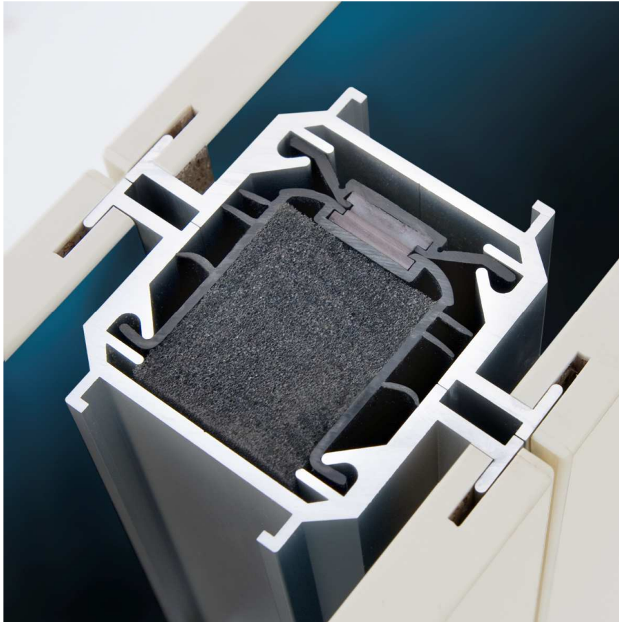
Paneelwanden met ingewerkte profielen (paneeldikte 113mm)